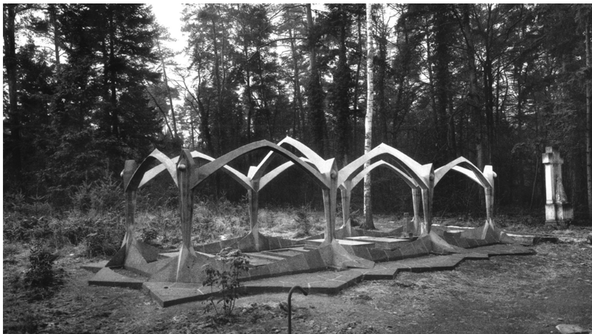
Abb. 1: Grabanlage Wissinger

Die in den 1920er Jahren von Max Taut geschaffene und 1987 restaurierte expressionistische Grabanlage "Wissinger" wurde durch einen umgestürzten Baum schwer beschädigt. Zudem zeigten sich weitere Schäden, die Untersuchungen im Vorfeld zukünftiger Restaurierungsmaßnahmen erforderlich machen.